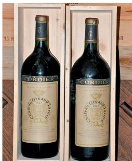
Ako darček sa veľmi dobre predávajú vína z ročníkov narodenia obdarovaného

Niekoľkokrát navštívil výstavu VINEXPO v Bordeaux a je v kontakte s francúzskou ambasádou.