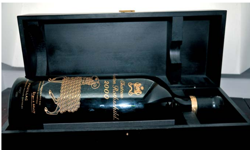
Niektoré fľaše si aj po vypití vína zachovávajú hodnotu. Napríklad táto od Château Mouton Rothschild je zdobená zlatom