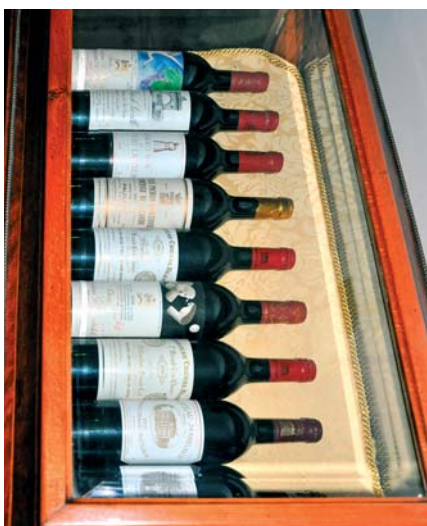
Všetky tieto vína dostali od Roberta Parkera sto bodov.