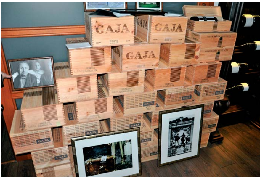
Aj vinárstvu Gaja robí spoločnosť SCHMIDT&CO. na Slovensku výhradného dovozcu

Každý z negociantov má vlastnú cenovú politiku, a preto je vhodné portfólio partnerov diverzifikovať s cieľom optimalizácie nákupných cien, aby ich vína následne na Slovensku mohol ponúknuť za čo najpriateľnejšie ceny. Pri potulkách po Bordeaux sa prostredníctvom negociantov zoznámil aj s majiteľmi a riaditeľmi mnohých špičkových vinárstiev, ktorí mu aktuálne posielajú ponuky z súkromných archívov na ich ročníkové vína za exkluzívne ceny.